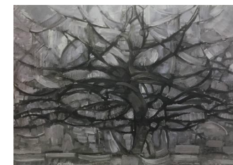
Piet Mondrian: Det grå træ 1911

Find et træ, der særligt tiltaler dig. Stil dig med ryggen tæt mod stammen. Luk øjnene og træk vejret dybt. Træet vil måske "fortælle" dig noget vigtigt! Vær lidt "modig" ..... omfavn træet! Sug til dig – af livets træ!