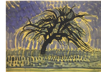
Piet Mondrian: Æbletræ i blåt 1908-10

Gå tur i skoven. Lige inden det grønnes, kan vi opleve de fine nuancer af violet, karminrød og grønt, der breder sig som en sart aura i omkring træets krone..... det varsler løvspring. Mal et "efterbillede" med de farver du husker.